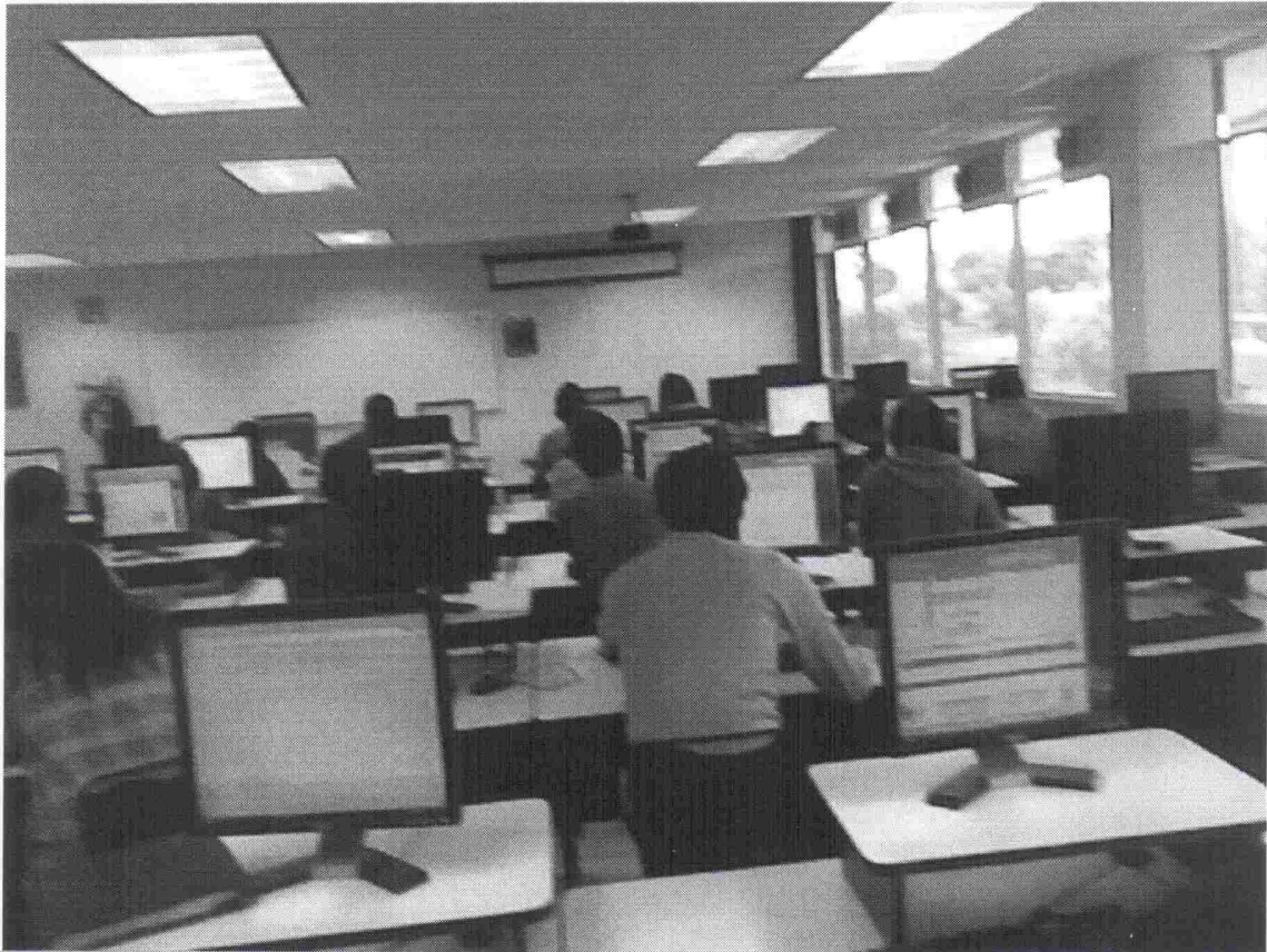
Croquis de sede

(Incluya fotografías de la sala, servicios como sanitarios, cafetería y accesos)